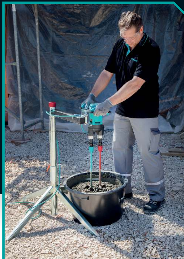
Xo 33 R duo