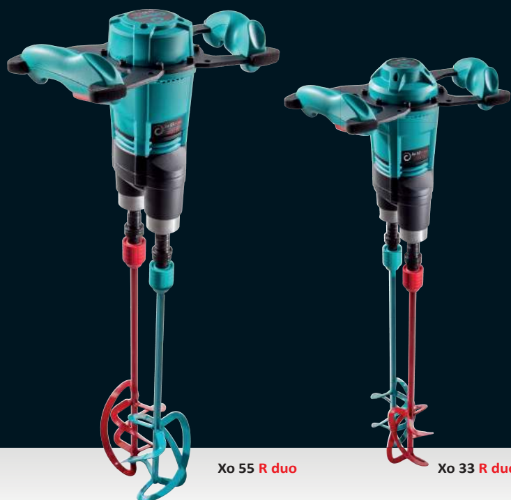
Xo 55 R duo